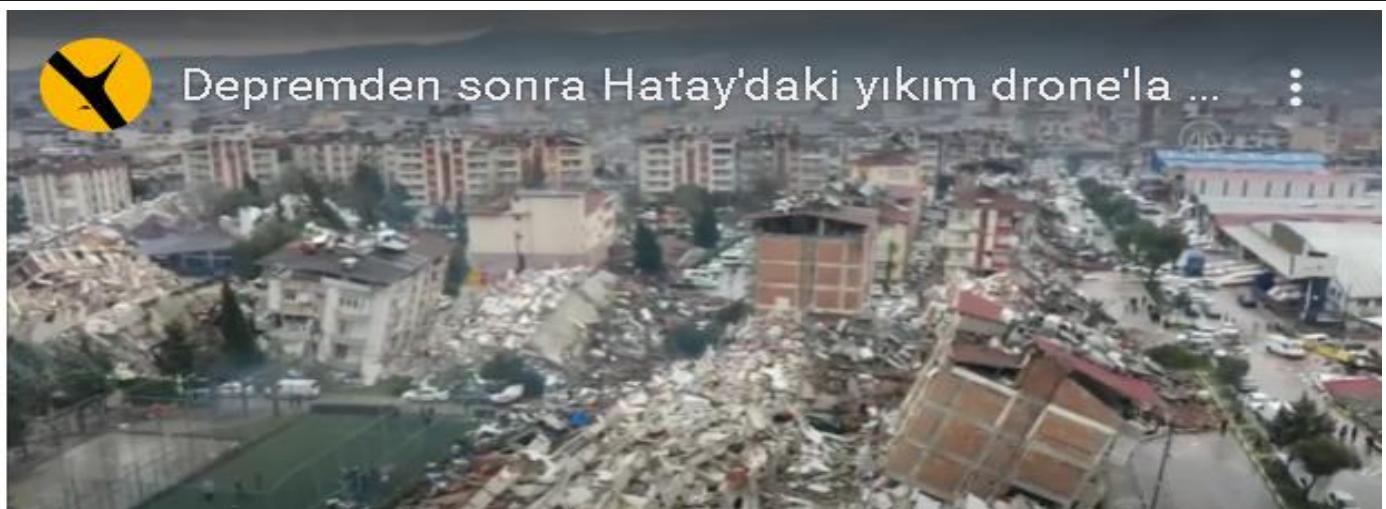
Mit Dronen Aufnahmen in Antakya

Wir als „ZeROChA e.V. mit unseren Partnern haben uns für das Gebiet „Antiochien“ in der Türkei konzentriert.